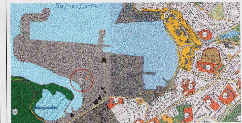
HLUTI ADALSKIPULAGS HAFNARFJARÐAR 1995-2015